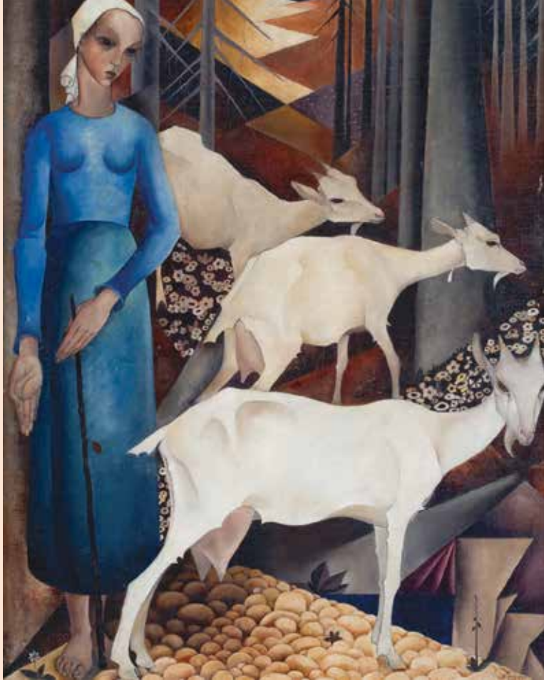
Jemmy van Hoboken, 'Herderinnetje in het Zwarte Woud', 1928