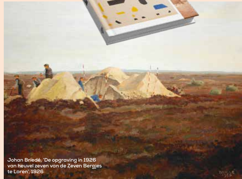
Johan Briedé, 'De opgraving in 1926 van heuvel zeven van de Zeven Bergjes te Laren', 1926